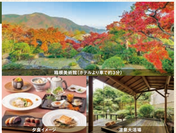
箱根美術館 (ホテルより車で約3分)

会員料金 1泊2食 19,700～26,700円 (一般料金 23,650～42,350円)