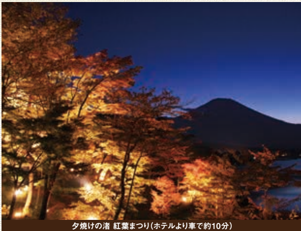
夕焼けの渚 紅葉まつり (ホテルより車で約10分)