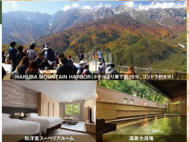
HAKUBA MOUNTAIN HARBOR (ホテルより車で約10分、ゴンドラ約8分)

会員料金 素泊まり+白馬岩岳マウンテンリゾート入場チケット付 7,750～12,750円 (一般料金 17,859～54,730円)